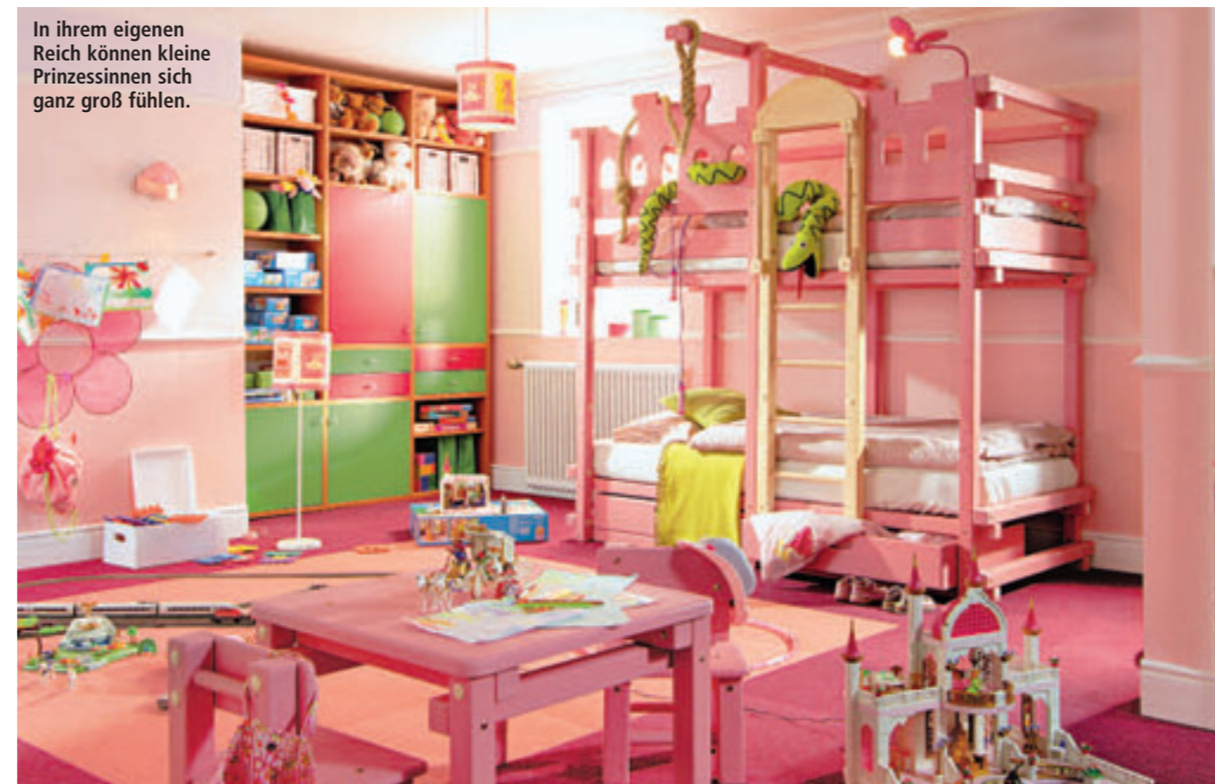
In ihrem eigenen Reich können kleine Prinzessinnen sich ganz groß fühlen.