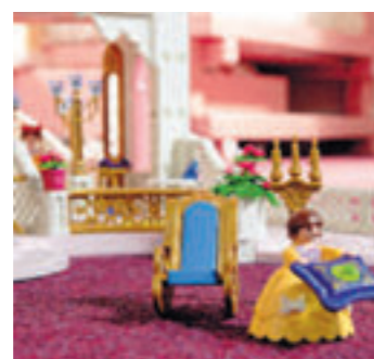
Auch die Spielzeugwelt spiegelt das Prinzessinnen-Thema wider.