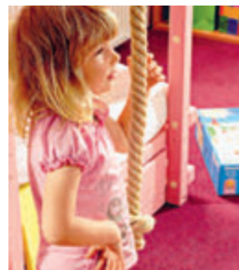
Kletterseile machen Spaß und fördern motorische Fähigkeiten.

viel Stauraum für Bettzeug oder Kuscheltiere. Am passenden Tisch kann zu zweit nach Herzenslust gemalt und gebastelt werden. Bei der Farbgebung überwiegt – ganz ladylike – Rosa in unterschiedlichen Nuancen. Frische Akzente in Pink und der Kontrastfarbe Grün setzen die farbig lackierten Türen der Regalwand. Auch die Woll-Auslege ware passt voll ins Farbkonzept. Vorteil: Durch das neutrale Muster kann sie auch dann im Zimmer bleiben, wenn dieses